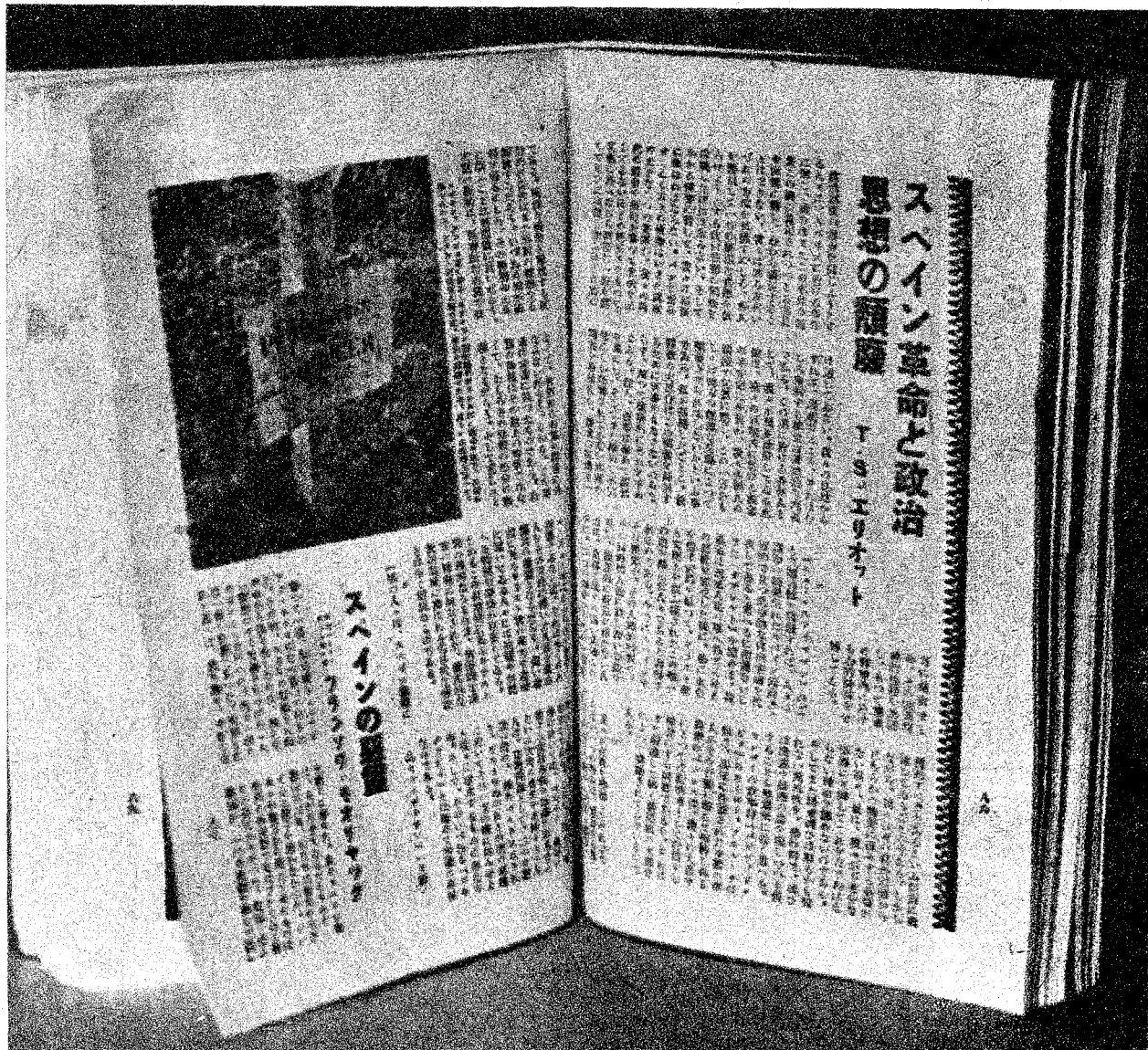
UNA PUBLICACION ANTIFASCISTA JAPONESA REPRODUCE, EN SU PAGINA CENTRAL, UNA FOTOGRAFIA QUE LE FUE FACILITADA POR EL COMISARIADO DE PROPAGANDA DE LA GENERALIDAD DE CATALUNA, ES DEL PRIMER BOMBARDEO DE PORTBOU, DURANTE EL CUAL CAYO UNA BOMBA EN TERRITORIO FRANCES, LOS GENDARMES LA RODEARON DE TELA METALICA Y COLOCARON UN LETRERO, PARA EVITAR POSIBLES ACCIDENTES