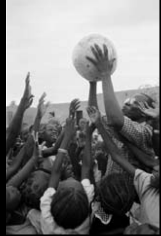
Ouagadougou (Burkina Faso)

Està escrit en la tradició oriental, penjar al vent els pensaments que altres poden fer seus. La cultura com a bé comú.