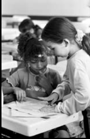
Porto Alegre (Brasil)

Fills de pares enfrontats en la guerra, ens recorden la importància de l'amistat per sobre de les diferències de tipus cultural o religiós.