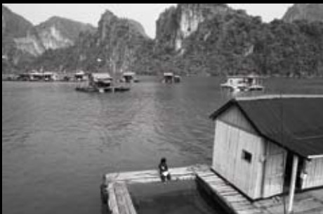
Badia d'Halong (Vietnam)

La realitat de moltes famílies en les quals, d'una manera o d'altra, i gairebé de manera natural, és escollit el rol de qui podrà gaudir de l'educació escolar; els altres membres de la família hauran de vetllar pels més petits.