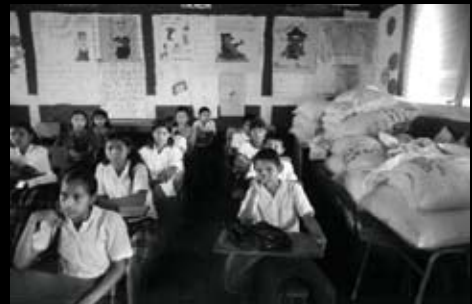
Ahuachapán (El Salvador)

Sovint, a les escoles d'aquests països, els estudiants reben part de la seva base nutritiva a través de programes de solidaritat. Aquesta fotografia constata que l'assistència a l'escola de molts alumnes és motivada per aquest fet. Probablement, aquesta és la seva única font d'alimentació.