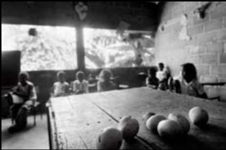
Rio Viejo (Colòmbia)

En aquesta imatge se'ns mostra l'únic alumne que ha estat seleccionat per la comunitat, el qual es convertirà en el dipositari i futur transmissor del coneixement acadèmic.