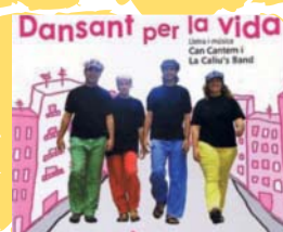
Grup Can Canthem

Festa de l'Espai d'Entitats (Tots els actes es faran al Gall Mullat)