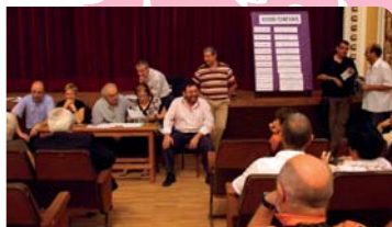
Sorteig de les obres del XXXIV Concurs de Teatre Vila de Piera

Sorteig de les obres del XXXIV Concurs de Teatre Vila de Piera al Foment de Piera