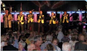
Concert i ball de vetlla

11.15 h Ofici religiós solemne a l'església de Santa Maria