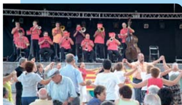
Cobla Sant Jordi Ciutat de Barcelona