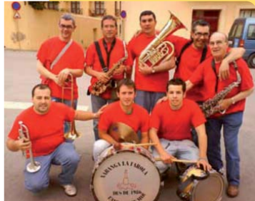
Xaranga La Farola