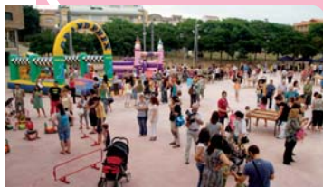
Activitats i entreteniments