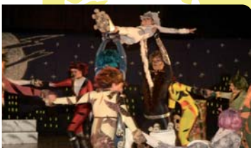
Festival de patinatge

22 h Concert amb MOULAY SHERIF-MÚSICA GNAWA a la plaça del Peix