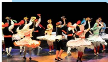
Esbart Dansaire de Rubí