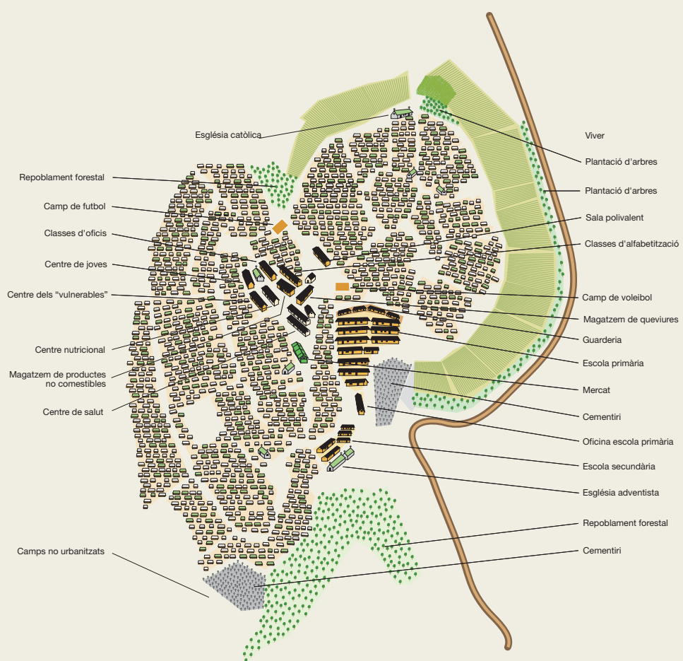
Plànol del camp de Gihembe

Els serveis bàsics, com ara latrines i distribució d'aigua, són comunitaris, agrupats per zones: per cada 20 persones correspon una latrina, i per cada 250 persones, una aixeta d'aigua