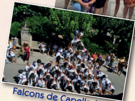
Falcons de Capellades